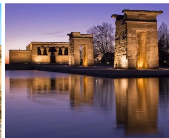
Templo de Debod