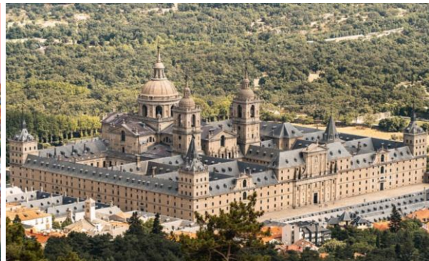
Real Sitio de San Lorenzo de El Escorial