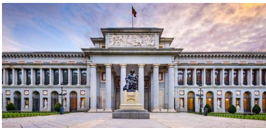
Museo del Prado