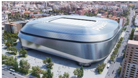
Stadium Santiago Bernabéu