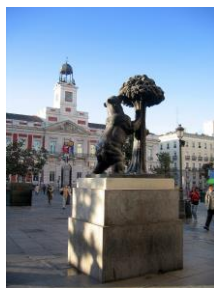
Puerta del Sol