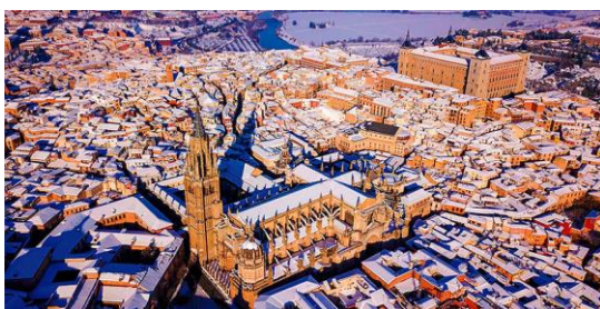
Toledo mit Kathedrale

Abendessen und Zugfahrt von Toledo nach Madrid