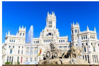
Plaza de Cibeles