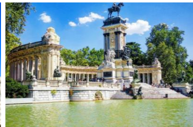
Parque del Retiro